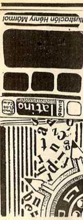
Ilustración Henry Marmor

En el Suplemento Trés Mil, hay una gran alegría por el V aniversario, ello significa más de 250 volúmenes que incluyen varios cientos de autores nacionales e internacionales.